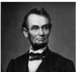
* Abraham Lincoln : Sinh năm 1809, bị ám sát năm 1865 .

• Câu số 3: Trong lịch sử Hoa kỳ, người ta biết là có tới 20 vụ “âm mưu – plot, conspiracy” ám sát các Tổng Thống trong khi các vị này còn đang tại chức hoặc đã kết thúc nhiệm kỳ. Trong số những vụ này, có 4 vụ ám sát (assassinations) đã thực sự cướp đi sinh mạng của 4 vị Tổng Thống còn đang tại chức. Dễ sợ quá ta! Vấn đề bảo vệ an ninh cho các vị Tổng Thống Mỹ được xếp vào loại...” cực kỳ cao cấp “chớ bộ giỡn sao! Thế mà vẫn còn bị...như thường. Vậy cho nên những thế lực ...thù địch xa gần, kẻ độc mồm, độc miệng cứ bảo là vấn đề súng đạn, bạo lực, giết người ở cái đất nước văn minh, vĩ đại, tự do, dân chủ hàng đầu thế giới là Hoa Kỳ này nó cũng...vĩ đại, ác ôn, khó chữa lắm chớ hồng có dễ đâu...nhất là khi các ông bà ở Quốc Hội với chính quyền không đồng tâm, nhất trí, một lòng vì nước, vì dân, cần chỗ này, kẹt chỗ kia, chổng chỗ này, phá nhau chỗ kia thì ... đối với dân chúng, đâu có bảo vệ, an ninh...vây quanh 4 phía, khi đứng, khi đi...nó bụp! bụp! pằng pằng!!! lúc nào cũng dễ như ta ăn cây cà kem không à .... Bốn vị Tổng Thống thực sự bị ám sát và qua đời sau khi sự việc xảy ra là các Ông ( lúc đó chưa có các Bà! Tuy nhiên, cuối năm 2016, sang đầu năm 2017 là...chưa biết chừng nghe!...). Bốn vị Tổng Thống đó là các ông :